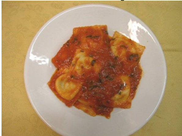
Ravioli della casa