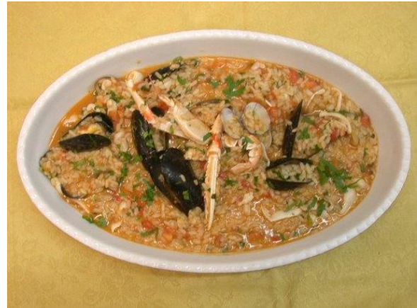
Risotto alla pescatora