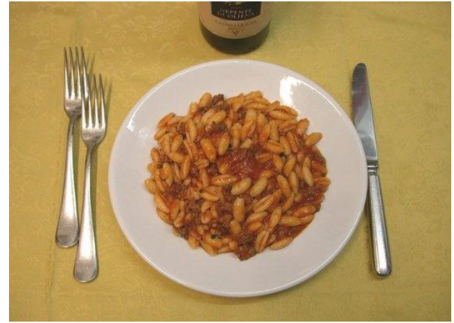
Gnocchetti alla sarda