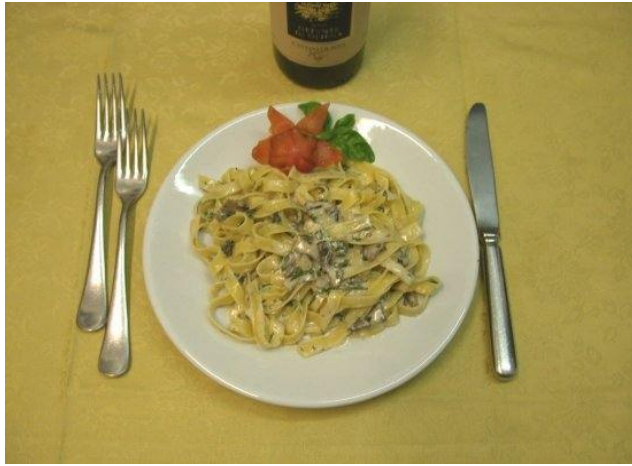
Fettuccine ai funghi