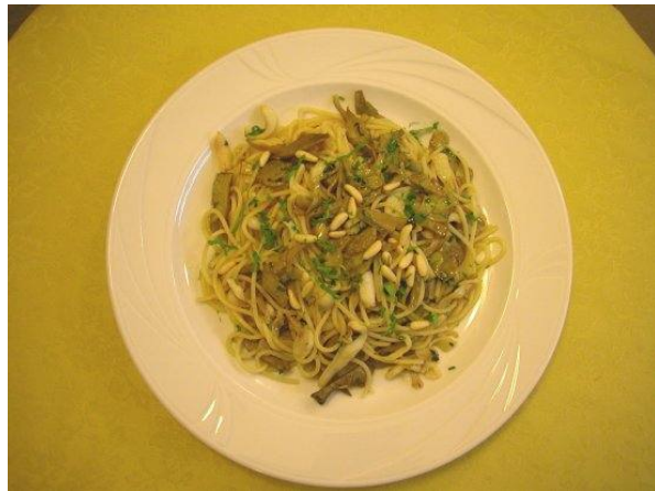
Spaghetti ai calamari e carciofi