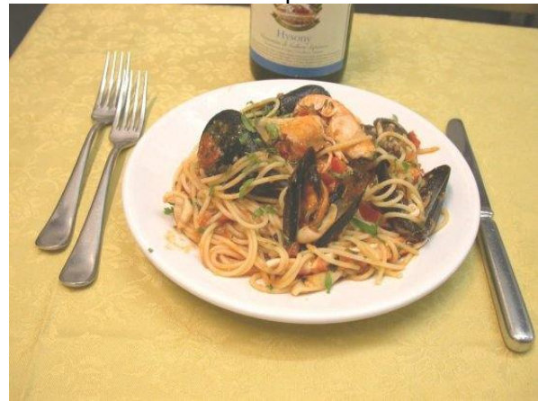
Spaghetti allo scoglio