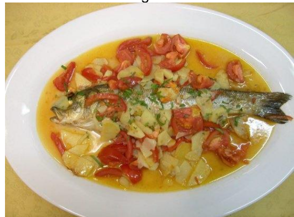
Spigola al forno con pomodori freschi