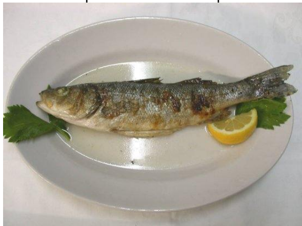
Spigola alla griglia