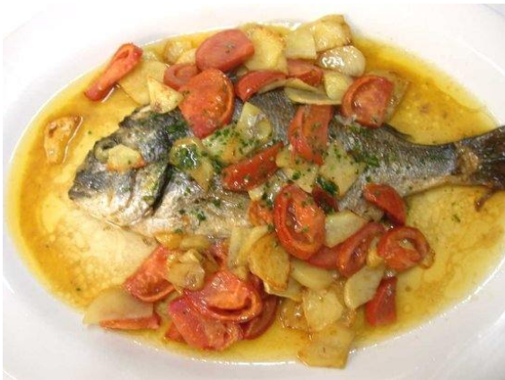
Pesci di prima al forno con pomodori