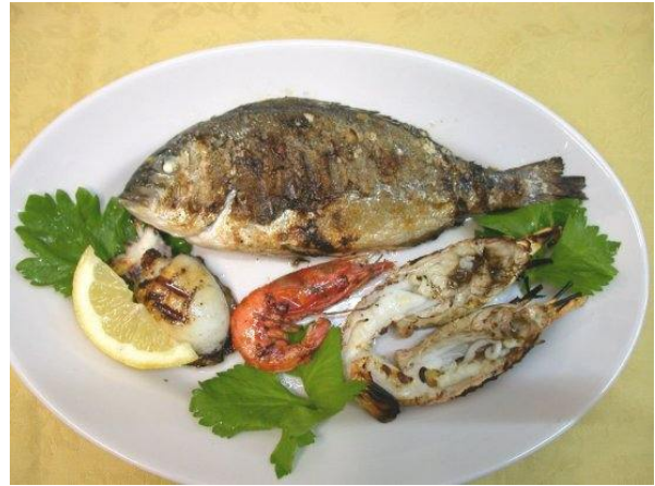
Grigliata mista di pesce