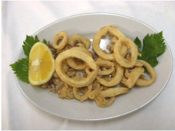
Fritto di calamari